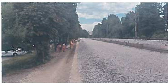
Interval Braşov – Stupini