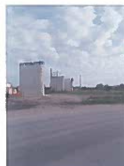
Pasaj Superior 191+938 Feldioara