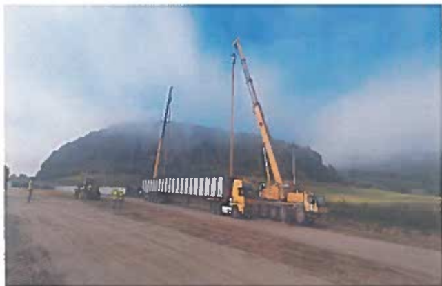
Aprovizionare tabliere viaduct