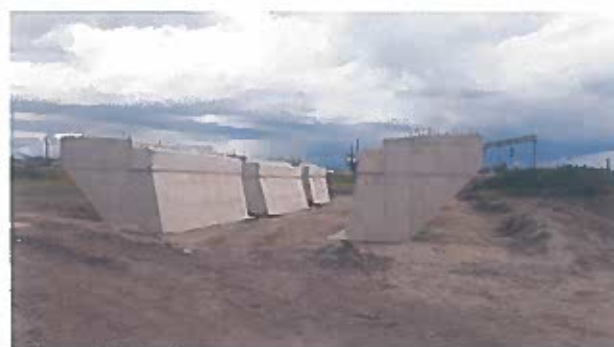
Pod Km 192+526.157 Feldioara