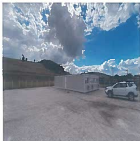
OS Rupea – instalare containere birouri